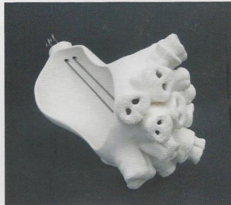
Trudi van Loon, Verbinding , 2012; aardewerk, gietklei, rvs satépinnen; 25 x 25 x 30 cm.